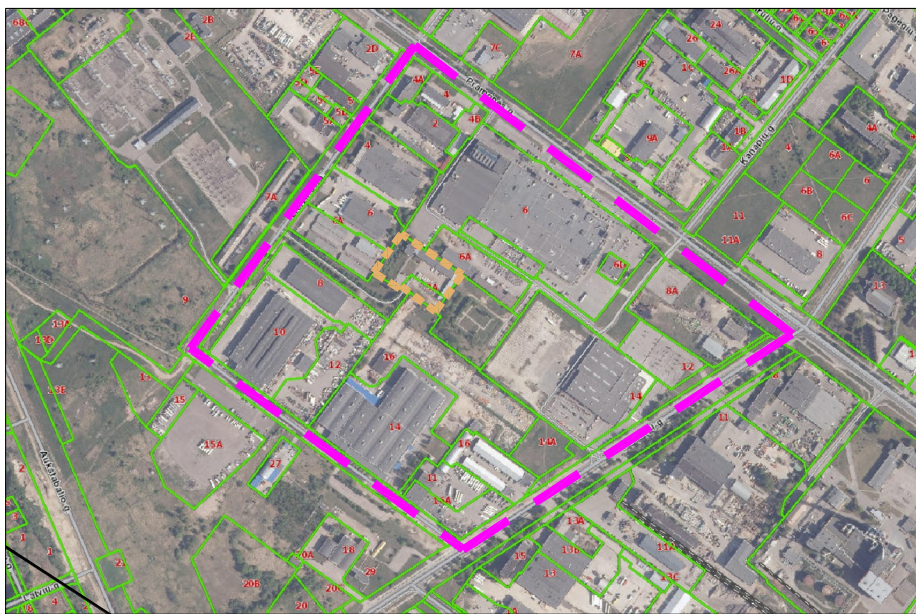
SITUACIJOS SCHEMA SU PLANUOJAMA IR NAGRINĖJAMA TERITORIJA